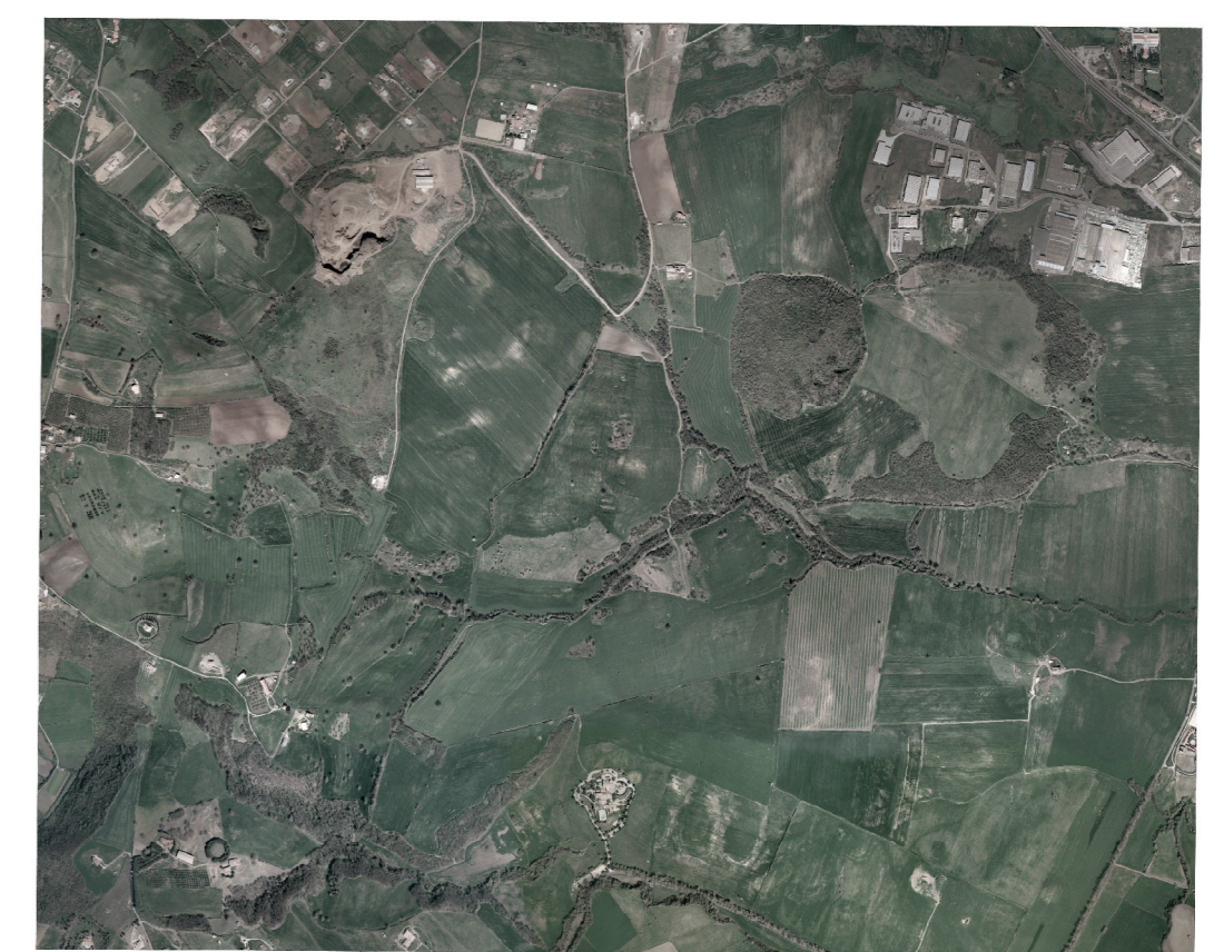
ORTOFOTO Scala 1 : 25000

A) ROMA B) VITERBO C) Nepi D) Trevignano Romano E) Monterosi