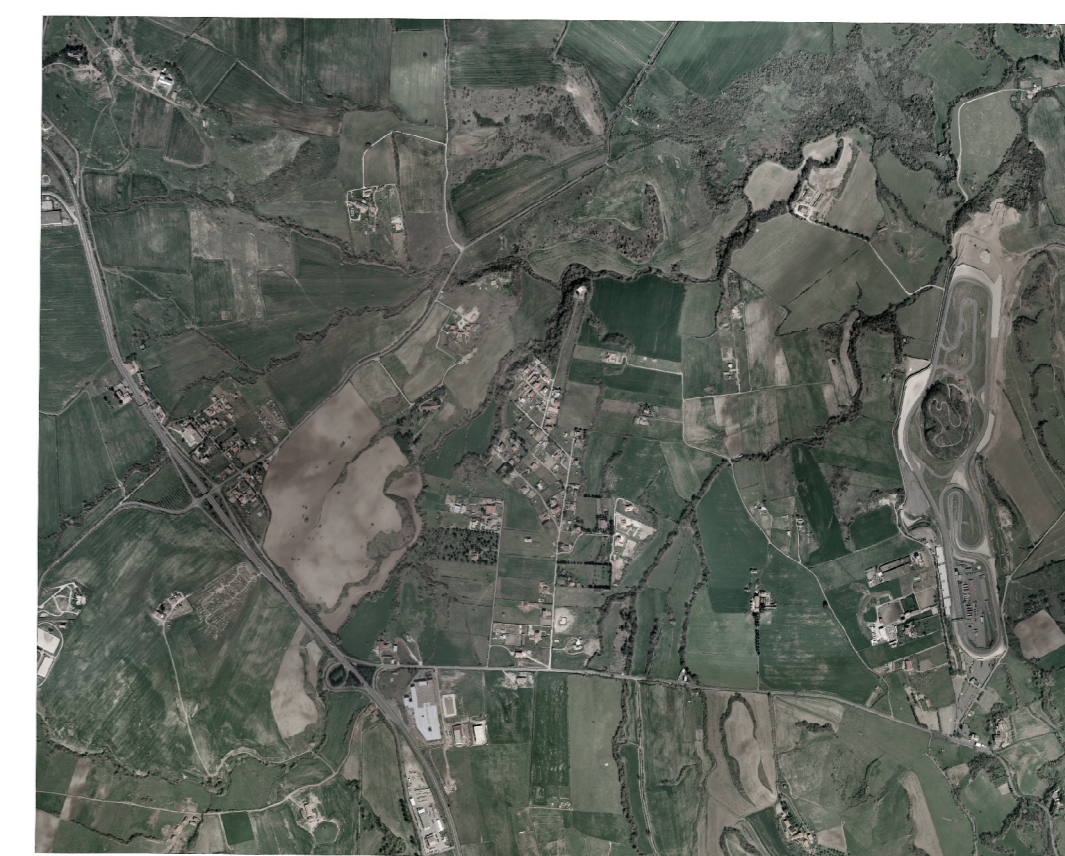
ORTOFOTO Scala 1 : 25000

al Nord B) Mazono Romano C) Campagnano Romano