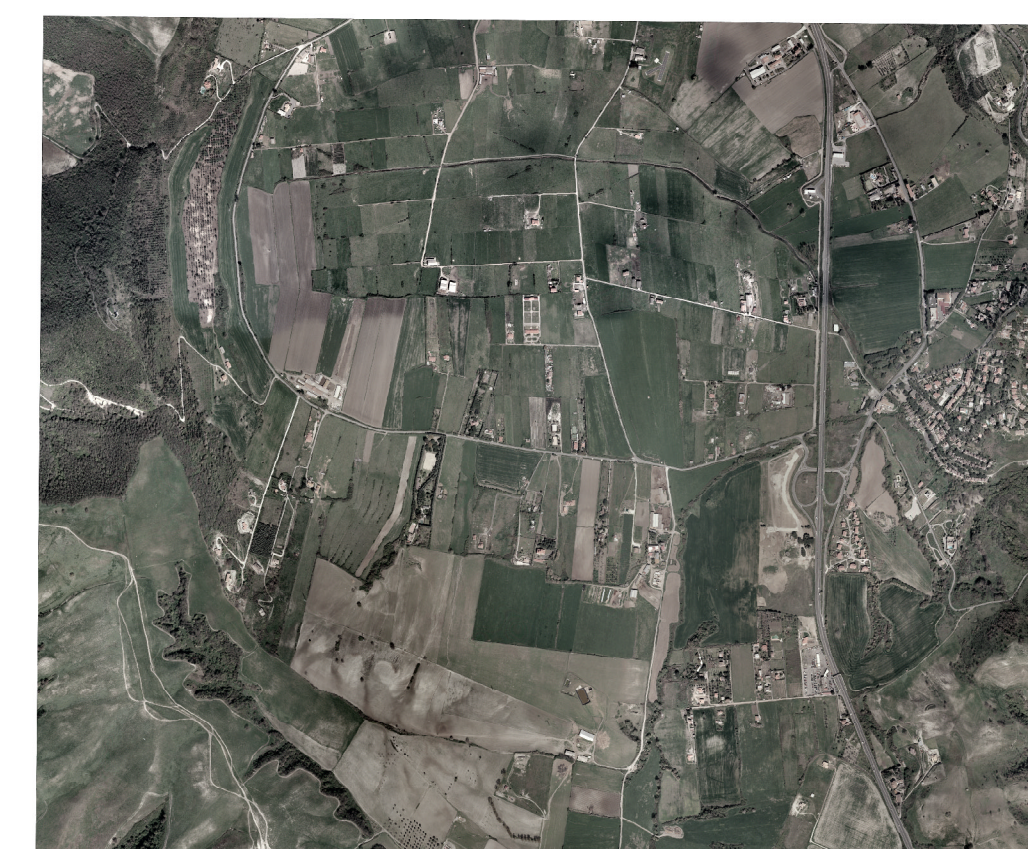
ORTOFOTO Scala 1 : 25000

A) ROMA B) VITERBO C) RETI a) Roma b) Campagnano di Roma c) Anguillara Sabazia