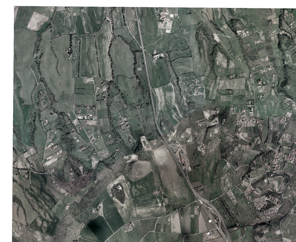
ORTOFOTO Scala 1 : 25000

Volo del 2002 di proprietà della Regione Lazio Restituzione del 2005