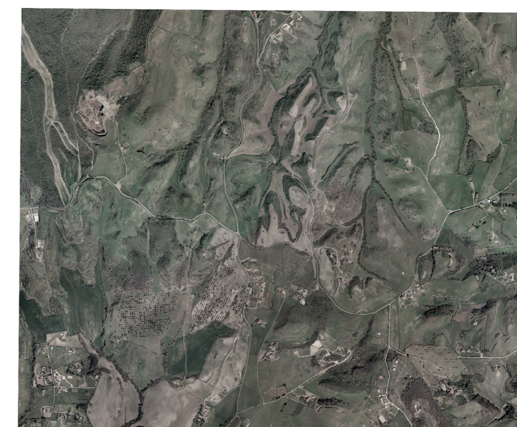
ORTOFOTO Scala 1 : 25000

a) Maccano Romano b) Magliano Romano c) Marano d) Castelnuovo di Porto e) Sacrofano f) Campagnano di Roma